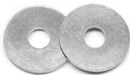
Beilagscheibe galv.verzinkt8,4x30mm. [2900S10]