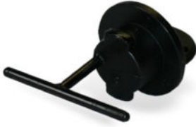
Ablassschraube [390020] Für Eskimo und Prijon Kajaks.