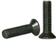
Senkkopfschraube Schwarz 8x25 mm [2900S5]