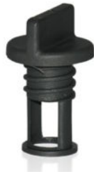
Ablassschraube mit Gewinde [390E20] für Eskimo Kajaks BJ vor 2005